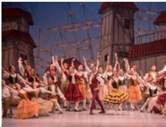
Ballet del Teatro Argentino de la Plata