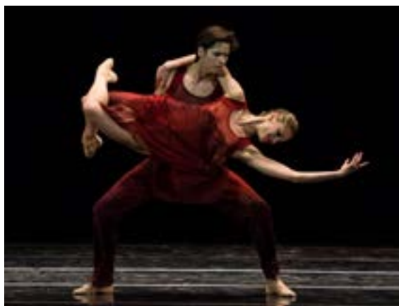
Ballet Contemporáneo del Teatro San Martín

Bailarín del Ballet Estable del Teatro Colón