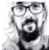
NANO METITIERE Diseño Multimedia